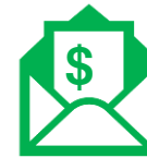
E-adreses ziņojums – e-rēķins

<DocumentKindCode>*****</DocumentKindCode>